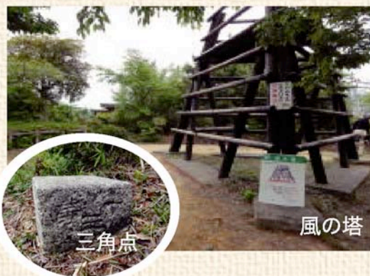
平草原は「風の塔」の奥に一等三角点があります。

た。県内の一等三角点はコウノ巣山(友ヶ島)、陣ヶ峰、生石山、明神山、城ヶ森山、真妻山、西山、楨山、平草原、法師山、善司ノ森山、峯ノ山、八郎山、烏帽子山の14座が在ります。一等三角点巡りも楽しいものですが如何ですか。手始めに平草原で三角点を探してみてもどうでしょう。ここは水平方向の移動を観測する菱形基線測点と、緯度と経度を測る天測点もある珍しい場所です。一等三角点は18cm角と一番大きく、石で囲われたり大事にされている所が多いのですが、友ヶ島の三角点は特に仰々しく扱われています。通常、文字を刻んだ面は苔が生えないように南向きに埋設されていますが、何故か平草原だけは西向きでした。