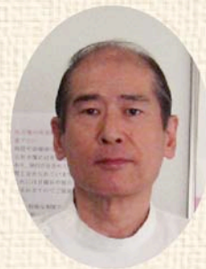
堅田内科循環器科

さて、私には特に健康法とってありませんが、六甲全山縦走(56km)を完走したり小雲取～大雲取超えを一日で踏破したり、歩くのは強い方です。ガイドブック片手に県下の目ぼしい山は殆ど登りました。写真を撮ったりしながら自分のペースで登れる単独行が