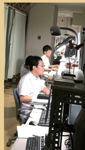
エコー検査所見入力の様子

最後になりますが検査部は現在、世代交代の時期でベテラン技師の退職に伴い20歳代の技師が多くなっています。経験不足から各科にご迷惑をお掛けする事があるかもしれませんが、フットワークでカバーしようとスタッフが一丸となって仕事することで活気があります。「働きがいのある職場」を目指して頑張っていますので、皆様、ご指導ご鞭撻をよろしくお願いいたします。