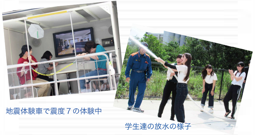
地震体験車で震度7の体験中

7月12日、防災訓練を行いました。今年は、地震体験車「ごりょうくん」に来ていただき、地震の揺れを体験しました。そして、消火栓・消火器の使用方法を学びました。