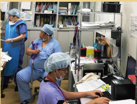
麻酔科医室での様子

1990年代以降、確実に副作用が少なく、安全な麻酔管理を可能にする技術が急速に進歩しました。まず投与開始後、速やかに効果を発揮し、中止するとすぐに効果が消失する麻酔に関連した薬剤が登場しました。またこれらの薬剤の投与量を、コンピューターでコントロールし、目標とする濃度に自動調整する投与方法が開発されました。さらにいろいろな薬物の相互作用を考慮して、適正な濃度に調整する知識が普及し、確実に副作用の少ない全身麻酔が可能になりました。安全に関しては、術中の患者さんの状態を監視するモニターが普及し、低酸素血症・換気不適切を迅速かつ確実に把握できるようになりました。またビデオ技術の進歩により、気道確保が容易かつ確実にできるようになりました。