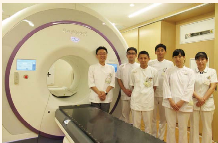
Radixact と放射線治療スタッフ

少しでも当院のがん診療に貢献できるよう、スタッフ一同、頑張っていきますので、今後ともよろしく願いたします。