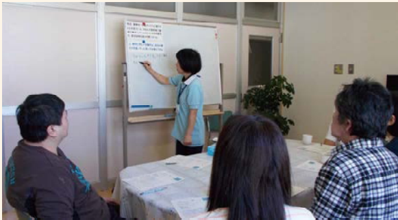
患者さんと意見交換

作業療法は医師の指示のもとに開始されます。平成30年度の実施総件数は15,025件、一日当たりでは入院患者59.8人、外来患者は1.6人でした。対象は圧倒的に入院患者が多く、日々病棟職員の協力を得て上記の件数に至っています。